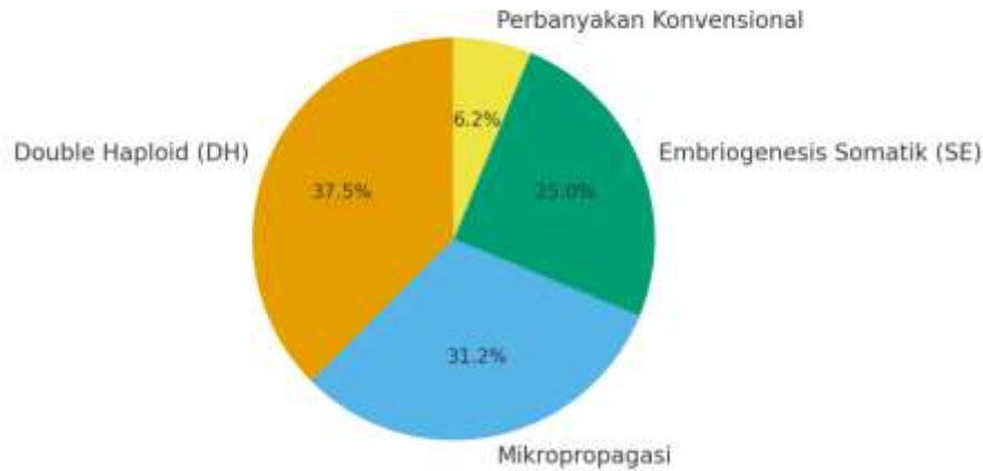
Gambar 2. Perbandingan kultur jaringan dan perbanyak konvensional dalam laju multiplikasi, keseragaman genetik, dan status bebas patogen.

Menurut Gambar 2, terlihat bahwa teknik DH dan mikropropagasi memiliki intensitas penggunaan dan bukti empiris yang paling tinggi dibandingkan teknik lainnya. Hal ini mencerminkan fokus utama dalam dua aspek krusial, yaitu percepatan waktu pemuliaan (melalui DH) dan peningkatan kapasitas produksi bibit (melalui mikropropagasi).