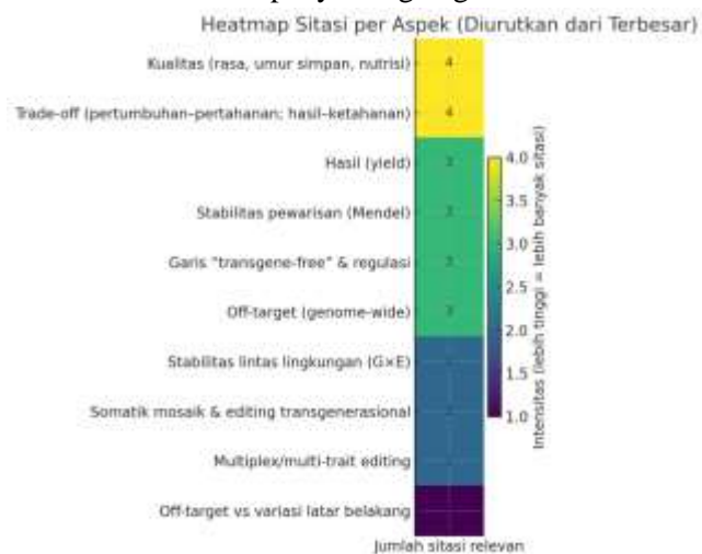
Gambar 3. Dampak penyuntingan genom CRISPR–Cas terhadap performa agronomik, risiko off-target , dan trade-off sifat.

Namun demikian, terdapat potensi trade-off , seperti antara pertumbuhan dan ketahanan atau antara hasil dan adaptasi lingkungan. Oleh karena itu, evaluasi multilokasi dan multimusim menjadi penting untuk memastikan stabilitas performa tanaman hasil penyuntingan genom.