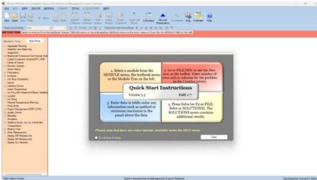
Gambar 1. Tampilan awal software POM-QM for Windows

Gambar 1 menunjukkan tampilan awal software POM-QM for Windows yang digunakan sebagai alat bantu dalam pengolahan data penelitian. Pada tahap ini, peneliti membuka aplikasi POM-QM sehingga seluruh menu analisis operasi, termasuk module waiting lines , dapat diakses. Tampilan awal ini merupakan langkah pertama sebelum melakukan pemilihan metode dan memasukkan data penelitian.