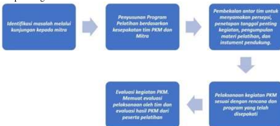
Gambar 2. Tahapan kegiatan pendampingan dan koordinasi program pengabdian