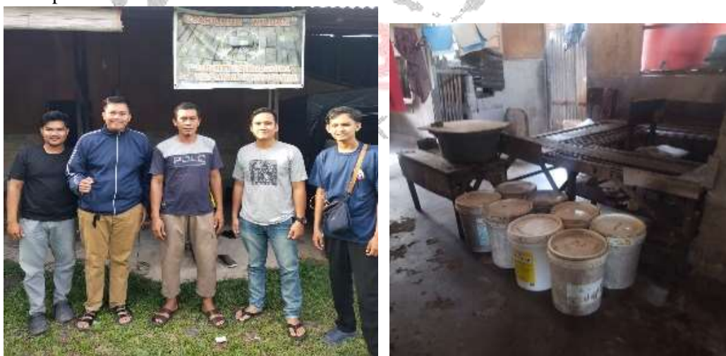
Gambar 1. Foto kegiatan PKM bersama Tim PKM ITB Riau Pesisir dan Peserta PKM.

Kegiatan pengabdian ini telah dilaksanakan pada bulan Januari 2026 sampai Maret 2026 di Jalan Semangka No. 88 B, Simpang Tetap Darul Ihsan. Kegiatan ini diisi dengan materi mengenai pelatihan perancangan produk oleh Bapak Muhammad Arif, ST, MT dan dilanjutkan teknik pembuatan alat kukus oleh Bapak Rudi Faisal, ST, MT lalu tentang pelaksanaan proses manajemen dan pemanfaatan alat kukus yang baru di rancang oleh bapak Soni Fajar Mahmud, S.Sos, M.Si. Jumlah peserta PKM diikuti oleh 6 orang peserta. Peserta antusias selama kegiatan ini, dibuktikan dengan kedatangan mereka yang tepat waktu, juga dalam mendengarkan penjelasan dari pemateri dan banyaknya pertanyaan yang diajukan seputar materi pelatihan.