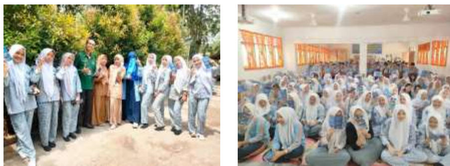
Gambar 1. Foto kegiatan PKM bersama Tim PKM ITB Riau Pesisir dan Peserta PKM.

Pengabdian kepada masyarakat ini bertujuan sebagai upaya meningkatkan pengetahuan mitra setelah mengikuti kegiatan sosialisasi dan promosi yang telah sama –sama dilakukan. Mitra diberikan pemahaman tentang perkuliahan, jenis program stusi yang ada, juga diberikan pemahaman tentang system perkuliahan sehingga dapat melanjutkan pendidikan dengan baik secara lebih mudah dan lancar.