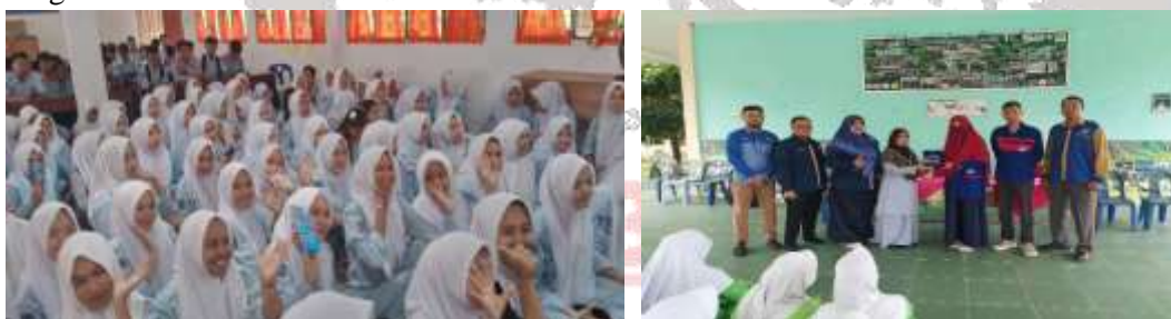
Gambar 2. Proses penjelasan tentang materi PKM oleh tim ITB Riau Pesisir

Evaluasi kegiatan dilakukan untuk mengetahui efektivitas kegiatan atau untuk mengetahui seberapa besar tujuan kegiatan pengabdian masyarakat ini telah tercapai, dan lebih lanjut menjadi suatu upaya yang merupakan upaya merekrut para calon mahasiswa yang berkelanjutan di masa mendatang.