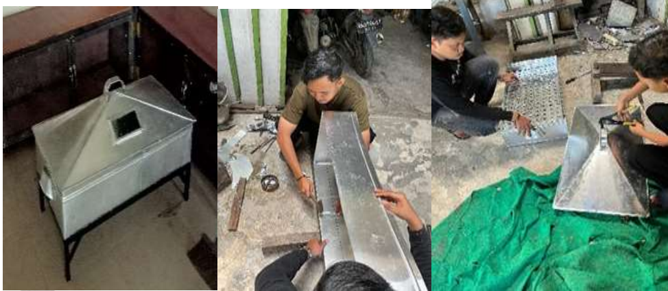
Gambar 2. Proses pembuatan Alat kukus pada saat PKM oleh tim ITB Riau Pesisir

Evaluasi kegiatan dilakukan untuk mengetahui efektivitas kegiatan atau untuk mengetahui seberapa besar tujuan kegiatan pengabdian masyarakat ini telah tercapai, dan lebih lanjut menjadi suatu unit usaha bisnis yang berkelanjutan di masa mendatang.