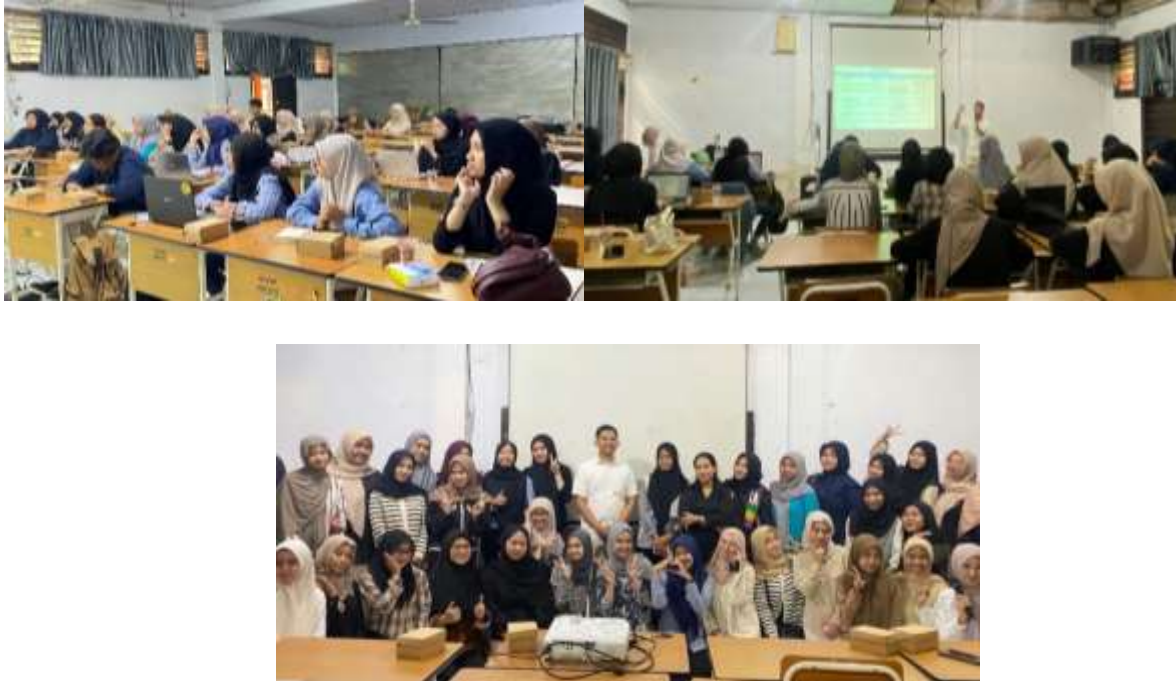
Gambar 3. Dokumentasi Kegiatan

Dari sisi konteks kelembagaan, kegiatan ini memberikan kontribusi terhadap penguatan budaya riset di lingkungan FEB UNM, khususnya dalam memperkenalkan pendekatan penelitian kualitatif sebagai alternatif metode penelitian akuntansi. Hal ini penting karena sebagian besar penelitian mahasiswa sebelumnya masih didominasi pendekatan kuantitatif. Penelitian oleh Thelwall & Nevill (2021) menunjukkan bahwa tren penggunaan metode kualitatif dalam penelitian sosial dan ekonomi terus meningkat secara global karena mampu menggali dimensi makna dan pengalaman manusia yang tidak dapat dijelaskan dengan angka. Oleh karena itu, peningkatan literasi metodologis mahasiswa akuntansi terhadap pendekatan kualitatif menjadi langkah strategis untuk memperluas wawasan penelitian mereka di masa mendatang.