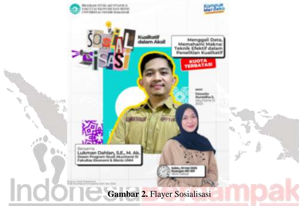
Gambar 2. Flyer Sosialisasi

Kegiatan pengabdian ini dilaksanakan dalam bentuk sosialisasi metodologi penelitian kualitatif yang berfokus pada penguatan pemahaman konseptual mahasiswa. Kegiatan ini diselenggarakan oleh tim dosen dan asisten peneliti dari Fakultas Ekonomi dan Bisnis Universitas Negeri Makassar (FEB UNM) sebagai bentuk respon terhadap rendahnya pemahaman mahasiswa akuntansi terhadap pendekatan penelitian kualitatif. Pelaksanaan kegiatan dilakukan pada bulan Mei 2025 di Ruang BD 201 Fakultas Ekonomi dan Bisnis Universitas Negeri Makassar.